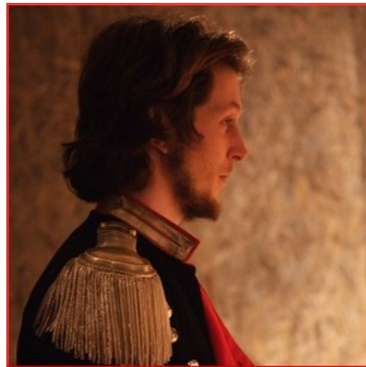
- Spettacolo teatrale Hamlet – affirmations – La Faiencerie theatre de Creil – Parigi